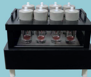
Quartz Digestion Pressure Vessel