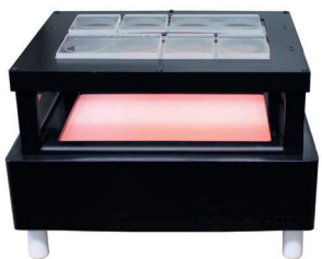
Heating Plate + Window Chamber