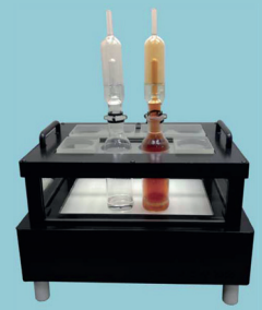
Quartz Cooling Trap Beaker